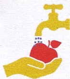
MYJ WARZYWA I OWOCE