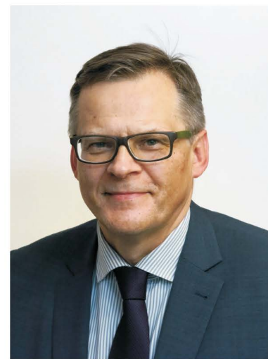
PREZES KASY ROLNICZEGO UBEZPIECZENIA SPOŁECZNEGO